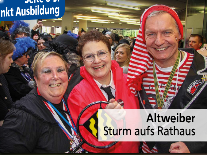
Altweiber Sturm aufs Rathaus