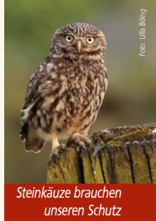
Steinkäuze brauchen unseren Schutz

Ein wichtiger Arbeitsschritt wurde bereits umgesetzt: Ende Januar errichteten NABU-Aktive am Littardweg in NV einen Amphibienzaun, um wandernde Kröten und Frösche vor dem Straßenverkehr zu schützen. Auch in den kommenden Wochen und Monaten gibt es zahlreiche Möglichkeiten, sich praktisch einzubringen.