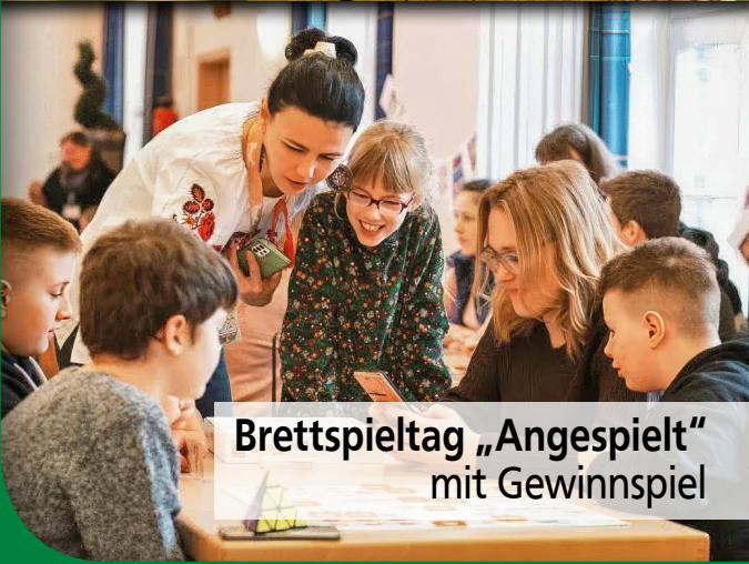
Brettspieltag „Angespielt“ mit Gewinnspiel

Februar 2026 · Ausgabe 613 | 56. Jahrgang