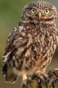
NABU Schutz der Lebensräume