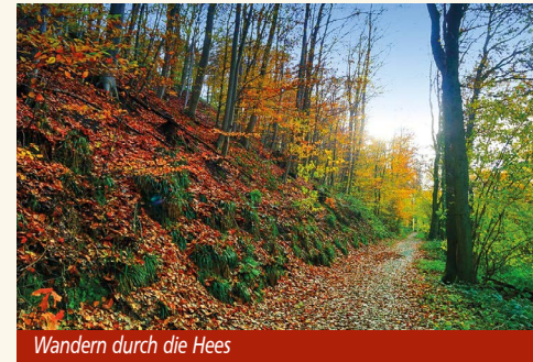
Wandern durch die Hees

Am Sonntag, 22. Februar, um 11.00 Uhr lädt Jürgen Weiß in Kooperation mit dem Heimat- und Verkehrsverein Neukirchen zu einer rund neun Kilometer langen Wanderung durch die Hees südlich von Xanten ein. Die Strecke führt rund um die ehemalige Luftwaffenmunitionsanstalt 2/VI, über den Philosophenweg bis zur Drususquelle. Unterwegs eröffnen sich Ausblicke auf den Xantener Dom; historische Bunkeranlagen und eine Gedenkstätte zur Explosion von 1942 geben Einblicke in die Geschichte der Region.