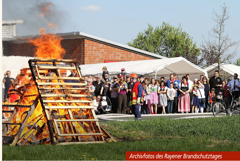
Archivfotos des Rayener Brandschutztages