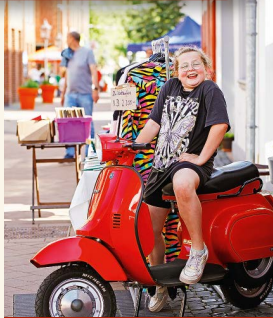
Der Dorftrödel ist immer für ein Schnäppchen gut! (Wir sprechen hier natürlich von der Vespa, d. Red.)