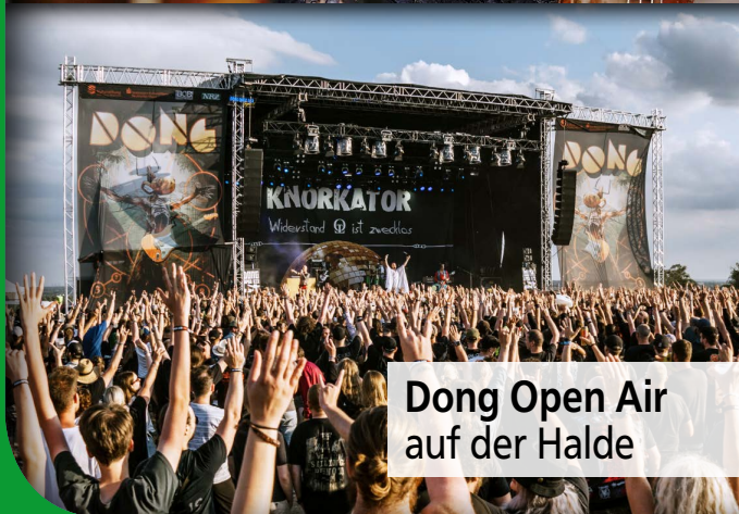
Dong Open Air auf der Halde