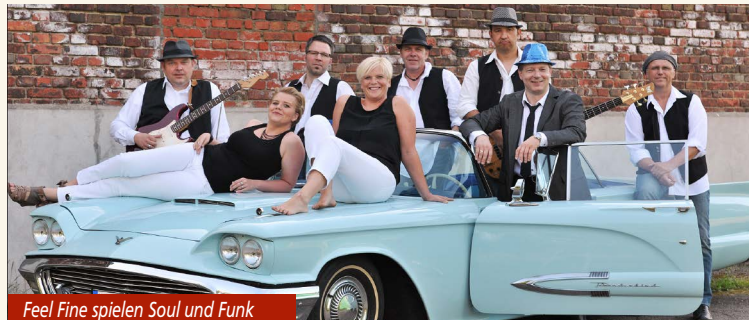
Feel Fine spielen Soul und Funk

Auch im Biergarten am Averdunkshof gibt es an diesem Wochenende Musik. Das Dong-Festival wird hier locker überört, wenn am Freitag, dem 14. Juli ab 18.30 Uhr die Cover-Band „Feel Fine“ in Aktion tritt. Mit acht Musikern auf der Bühne bieten sie eine Soul & Funk-Show, bei der niemand stillstehen kann! Auf die Ohren gibts Hits und Disco-Klassiker von Stevie Wonder, Aretha Franklin, Kool & the Gang und vielen mehr. Und das allerbeste: Der Eintritt ist frei!