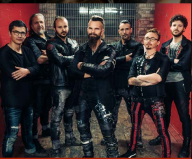
Saltatio Mortis aus Karlsruhe