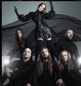
Die Freitag-Headliner Epica

T Festivalkarten waren bei Redaktionsschluss noch verfügbar: Sie kosten 129,99 € inklusive Camping, für Jugendliche nur 29,99 € (limitiert). Tagestickets gibts für 69,99 €. Kartenvorverkauf, das komplette Festivalprogramm und alle weiteren Infos unter www.dongopenair.de .