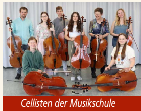
Cellisten der Musikschule

Das Höfefestival bringt auch in diesem Jahr zeitgenössische, improvisierte Musik an ungewöhnliche Spielorte: Ein Bauernhof ist nicht unbedingt das natürliche Biotop avantgardistischer Musiker. Doch genau das passiert beim Höfefestival: zeitgenössische Musik findet in teilweise hunderte Jahre alten Hofstellen eine wunderbare Kulisse. Dabei geht es nicht allein um die Kunst: Ziel ist es, den Konzertbesuchern auch einen erweiterten und neuen Blick auf Orte ihrer Heimat zu verschaffen.