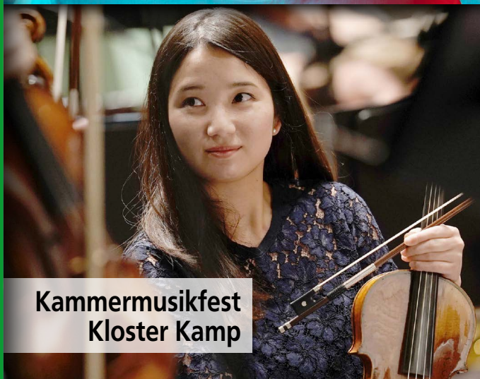
Kammermusikfest Kloster Kamp