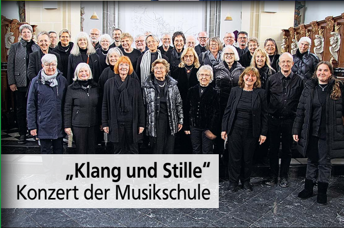
„Klang und Stille“ Konzert der Musikschule