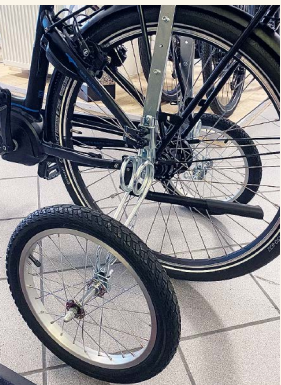
Vermitteln Sicherheit: die Stützräder für Erwachsene vom FahrRadCenter Tendick

www.kensho.de · Sport- und Gesundheitszentrum · Weserstr. 23