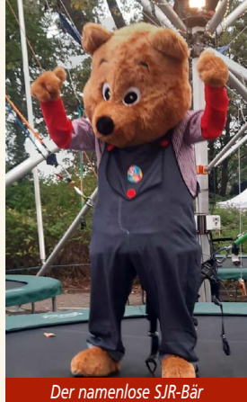
Der namenlose SJR-Bär

„Bär?“ – „Ja, du! Komm' mal her, Bär!“ – „Herbert...?“ – Man sieht schon, so kann das nicht weitergehen mit dem Bären, der seit einer Weile beim Stadtjugendring wohnt: Der arme hat doch tatsächlich noch keinen Namen. Nachdem er schon auf einigen Stadtfesten unterwegs war und sich immer nur mit „Bär“ vorstellen konnte, will er unbedingt einen Namen. Die Kinder haben schließlich auch alle einen, ganz viele verschiedene sogar. Deswegen sollen sie ihm jetzt helfen und Namensvorschläge schicken. So kann er sich den schönsten aussuchen!