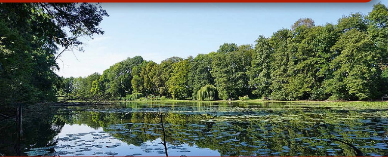
Das Naturschutzgebiet Littard bietet einige tolle Ausblicke – auch wenn sie sich derzeit wohl etwas weniger grün präsentieren...