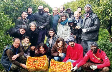
Die Orangen werden beim Verein SOS Rosarno in Kalabrien fair produziert.