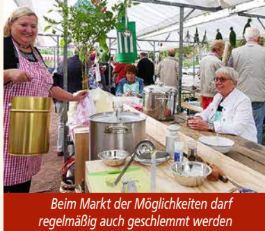
Beim Markt der Möglichkeiten darf regelmäßig auch geschlemmt werden

Parallel zum wöchentlichen Bauernmarkt findet im Sommer jeweils am ersten Donnerstag im Monat der „Markt der Möglichkeiten“ statt. Ab September stellt er sich neu auf – im Wortsinn, denn zu finden sind die bunten Stände von Händlern und Ehrenamtlern ab Donnerstag, den 1. September auf der Hochstraße. Vom Denkmalplatz bis zur Dorfkirche gibt es Selbst- und Handgemachtes sowie Frisches aus der Region.