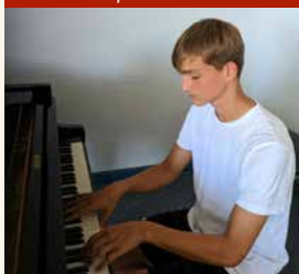
Die Konzertproben laufen...