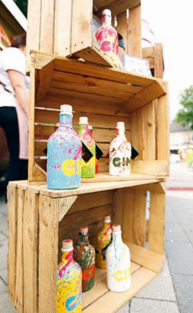
Genießen auf dem Vluynner...