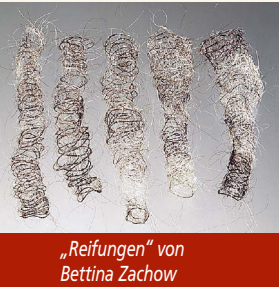
„Reifungen“ von Bettina Zachow

Die Kirchen laden nach der Corona-Zeit mit ihren vielen Einschränkungen herzlich ein, dem Gemeinschaftlichen und seinem Wert wieder mehr Aufmerksamkeit zu schenken, es neu zu pflegen und natürlich zu feiern!