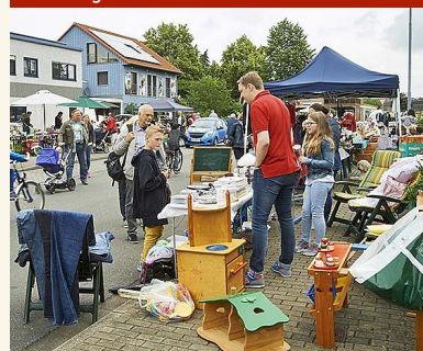
Garagentrödel auf der Raiffeisenstraße

Auch in diesem Jahr beteiligen sich die umliegenden Anwohner mit einem Garagentrödel, bei dem sicherlich das ein oder andere Schnäppchen auf die Besucher wartet. Beim SV Neukirchen können Besucher ihre Wurfgeschwindigkeit messen lassen, und die beiden Karnevalsvereine der Stadt sind ebenfalls vor Ort. Für Begeis-