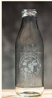
Milchflaschen für die Fans

Das nächste Projekt steht ebenfalls schon in den Startlöchern: Für die Milch-Fans entstehen Paschenhof-Flaschen mit eigener Gestaltung. Spülmaschinenfest – und regional per Laser graviert bei High Class Photo in Vluyn!