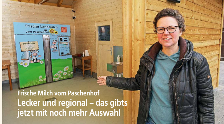
Frische Milch vom Paschenhof Lecker und regional – das gibts jetzt mit noch mehr Auswahl