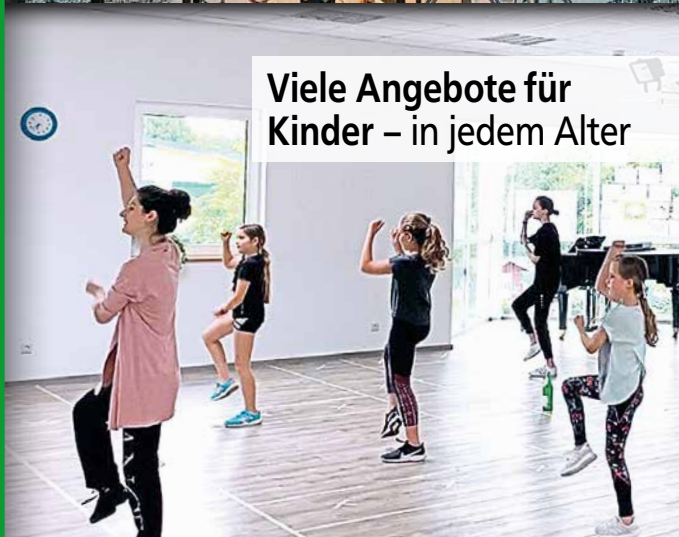
Viele Angebote für Kinder – in jedem Alter