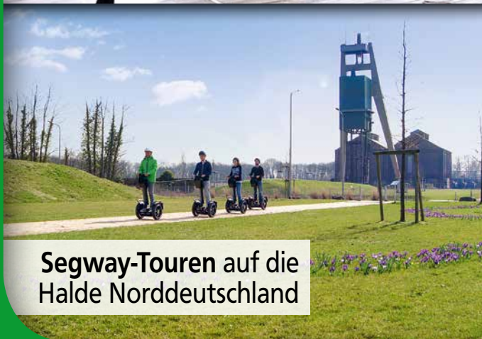
Segway-Touren auf die Halde Norddeutschland