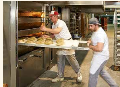
Biobäcker und -konditoren erhalten bei Schomaker eine vielseitige Ausbildung.

Ausgabe Sept.: Redaktionsschluss – 12. Aug. Anzeigenschluss – 14. Aug.