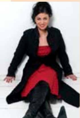
Autorin Hatice Akyün liest